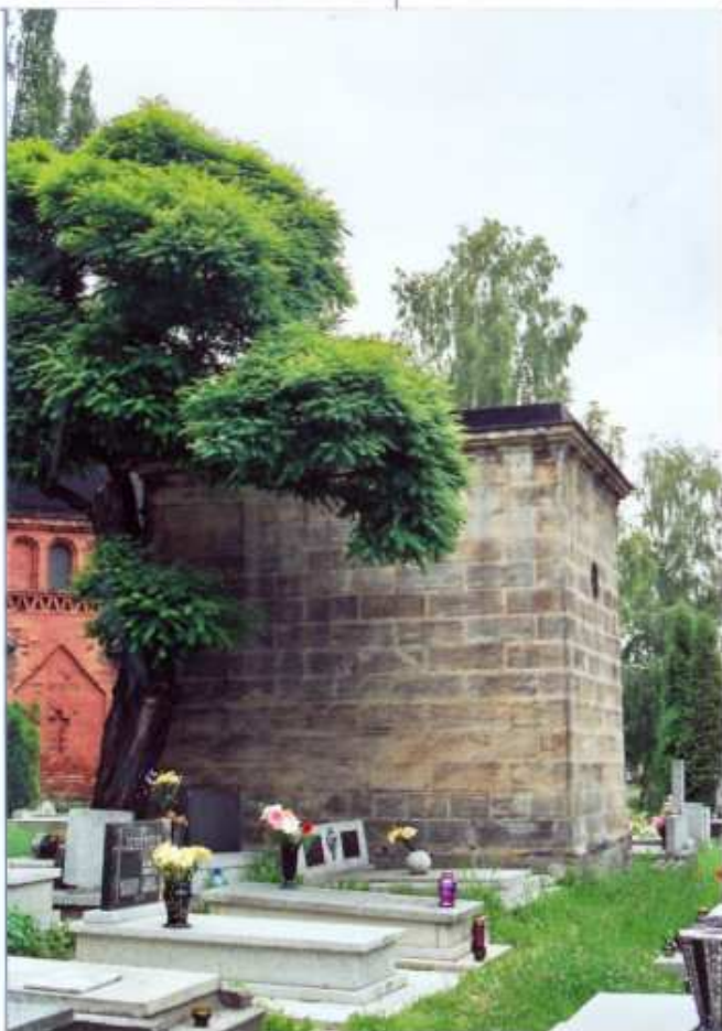
1 - ELEWACJA BOCZNA I TYLNA