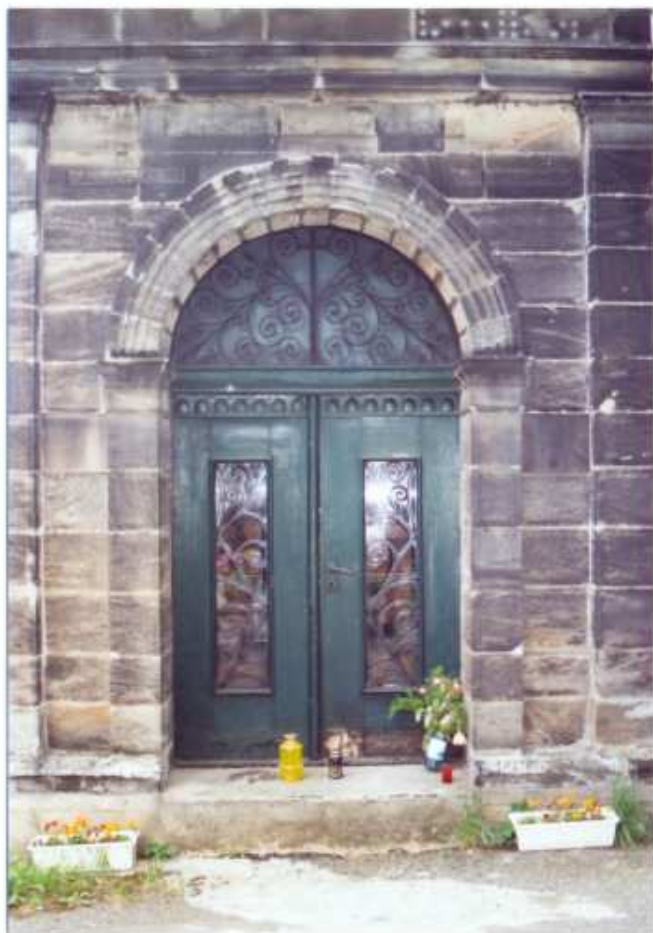
4 - DRZWI DO KAPLICY