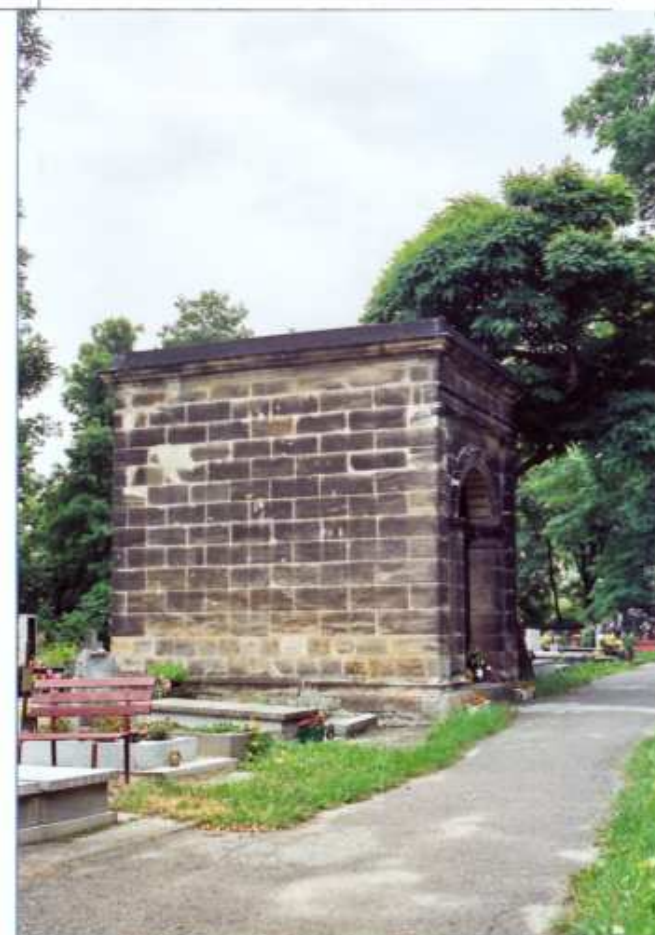
3 - ELEWACJA BOCZNA

Wkładkę złożyła Irena Kontna - czerwiec 2003 roku