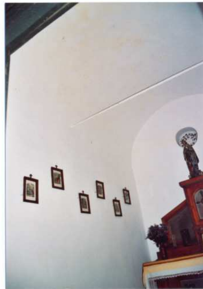
6 - WNIĘTRZE - SKLEPIENIE