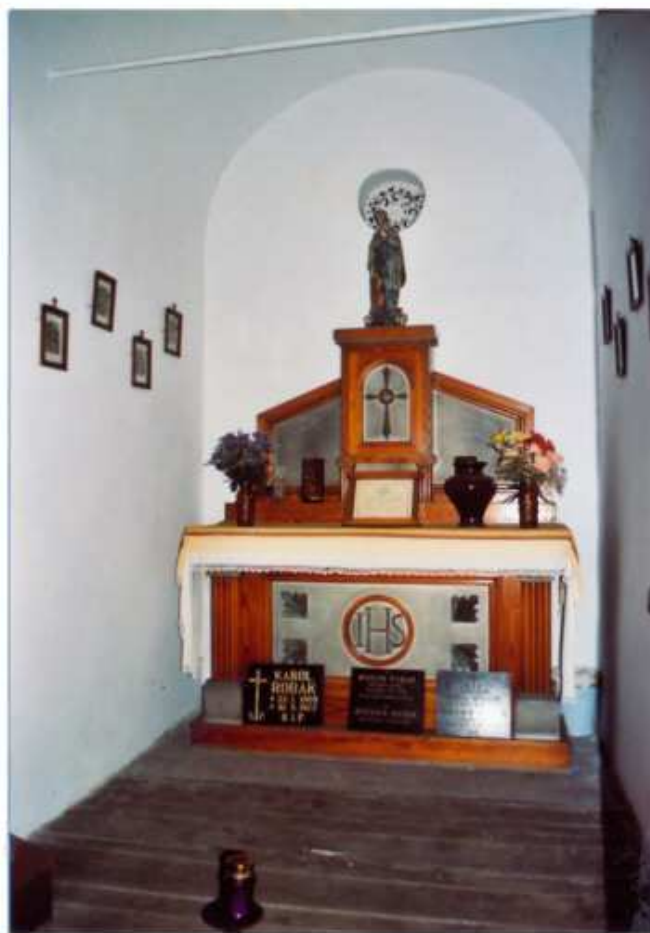
5 - WNIĘTRZE - OLTARZYK