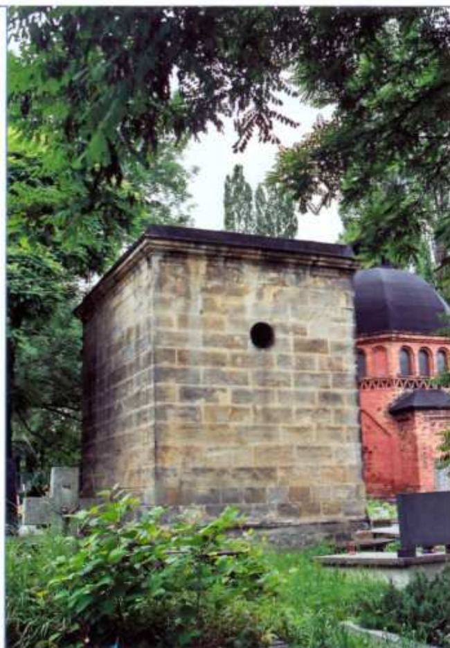
2 - ELEWACJA BOCZNA I TYLNA