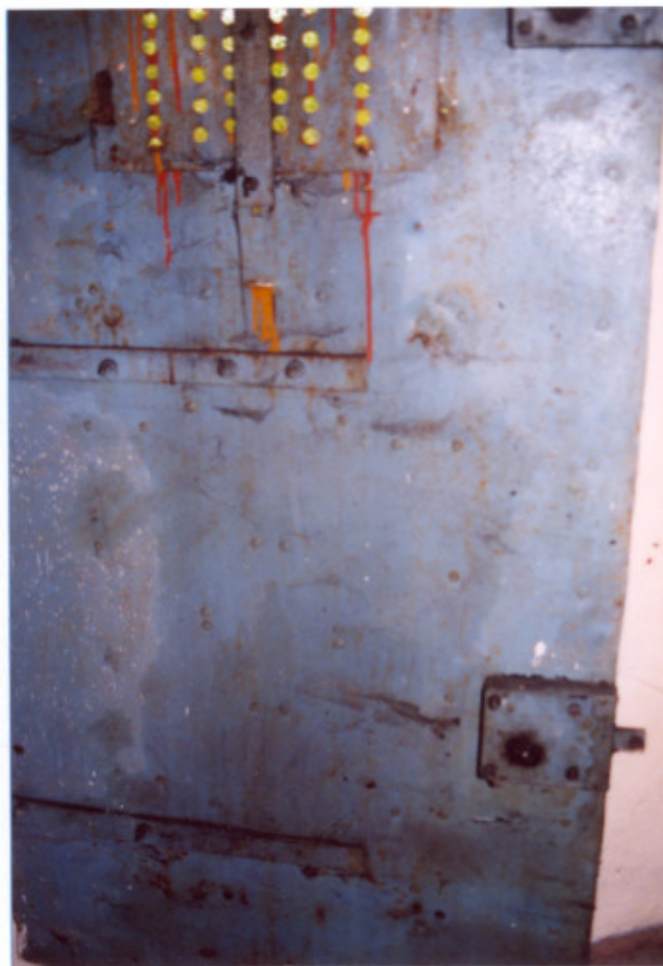
5. Drzwi – widok od wewnątrz.