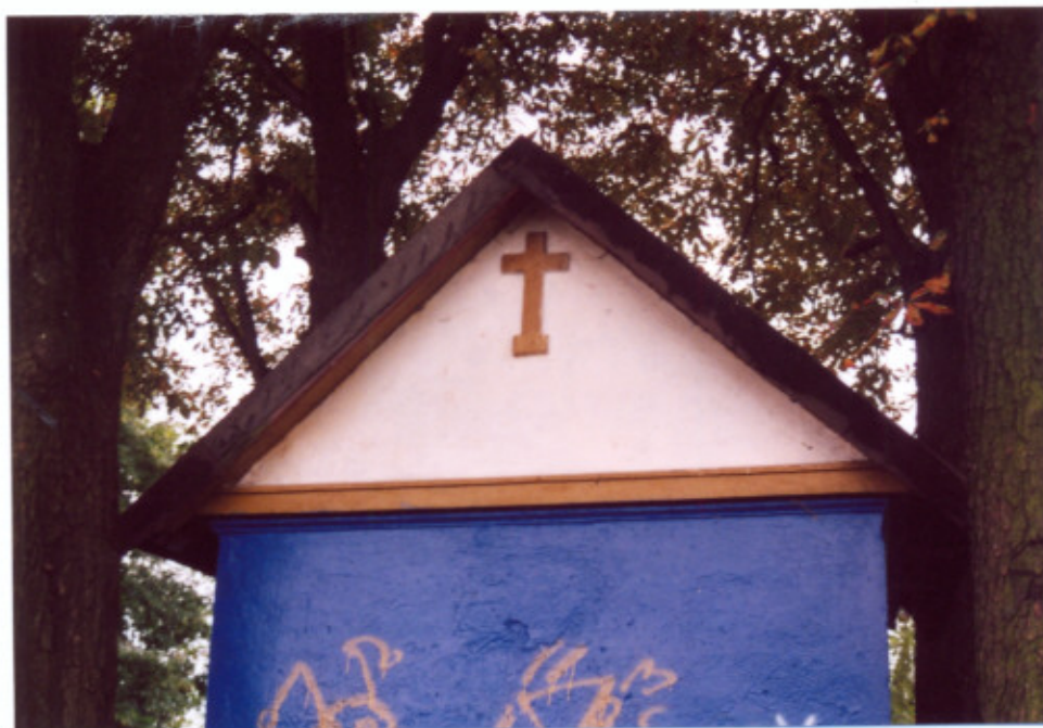
9. Elewacja wschodnia. Szczyt.