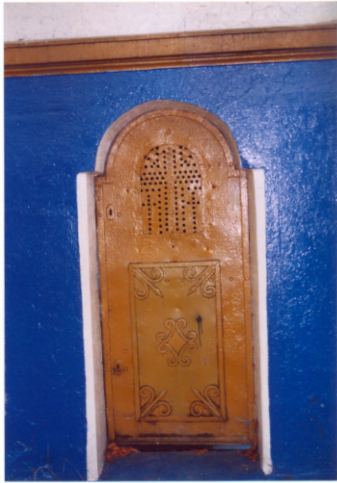
2. Elewacja zachodnia-frontowej. Drzwi.