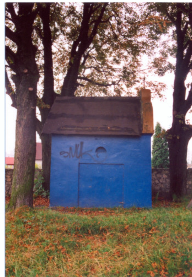
6. Elewacja północna.