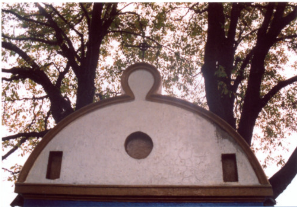
3. Elewacja zachodnia. Szczyt.