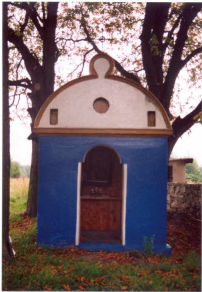
1. Elewacja zachodnia-frontowa.