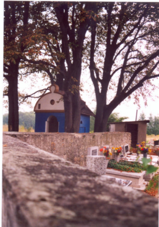
8. Kaplica. Widok od południowego-zachodu.