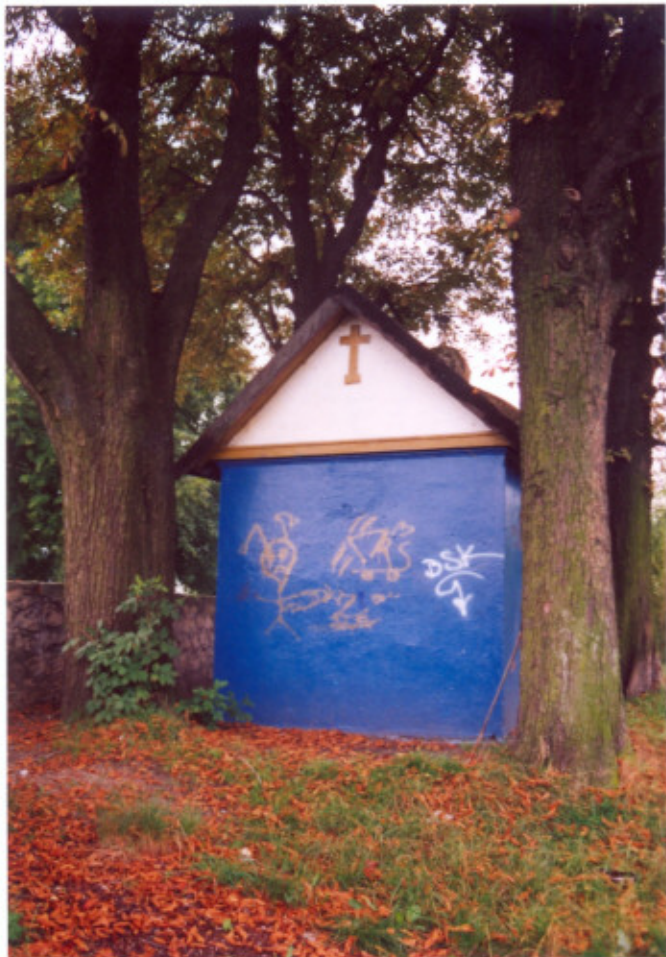
7. Elewacja wschodnia.