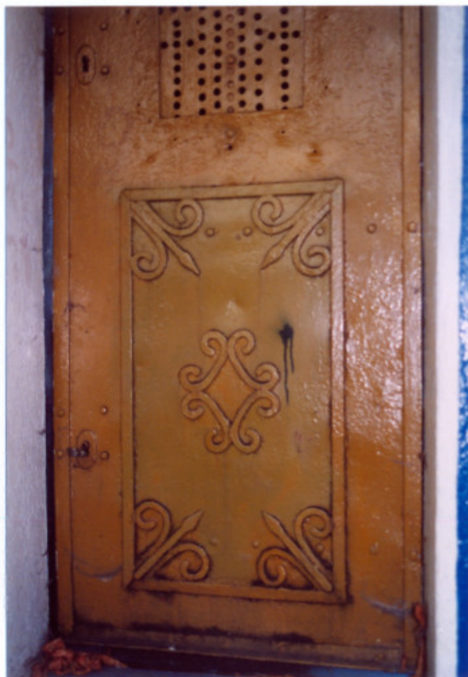
4. Drzwi. Detal.