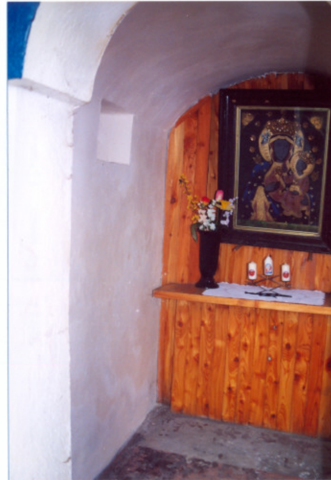
11. Wnętrze kaplicy. Widok ogólny.