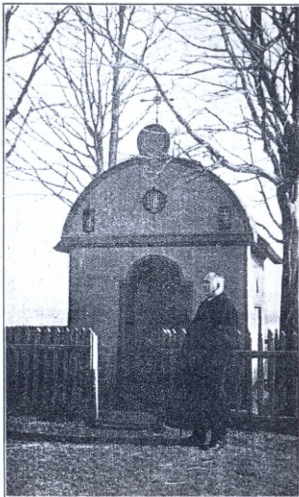
Kaplica na górze słupeckiej.

Ikonografia, dokumentacja fotograficzna.