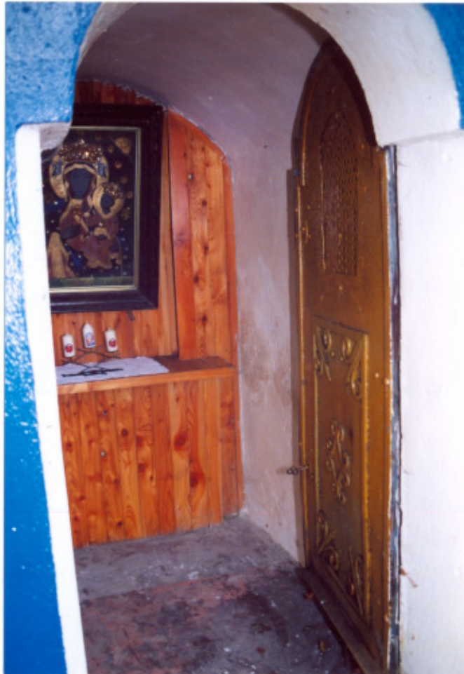
10. Wnętrze kaplicy. Widok ogólny.