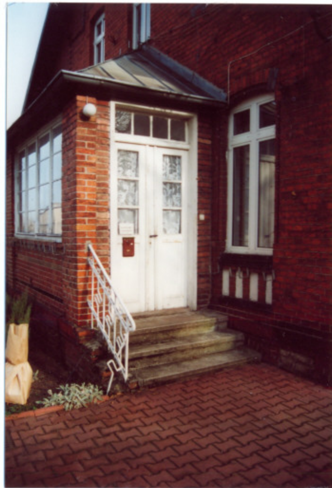
7. Frag. elewacji południowej-tylnej. Ganek.