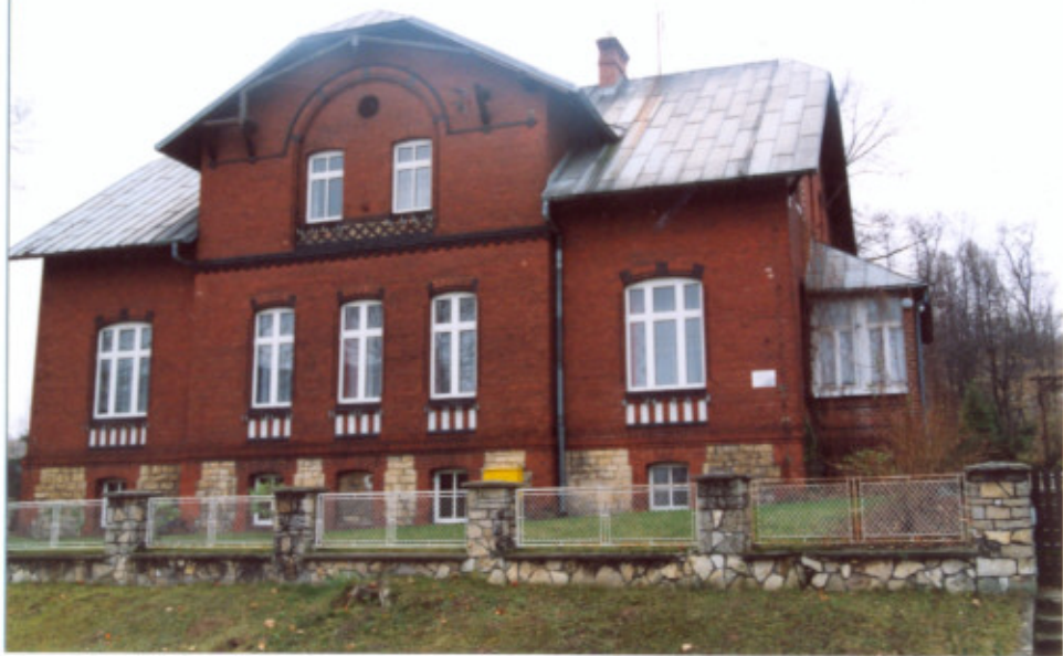
1. Elewacja północna- frontowa.