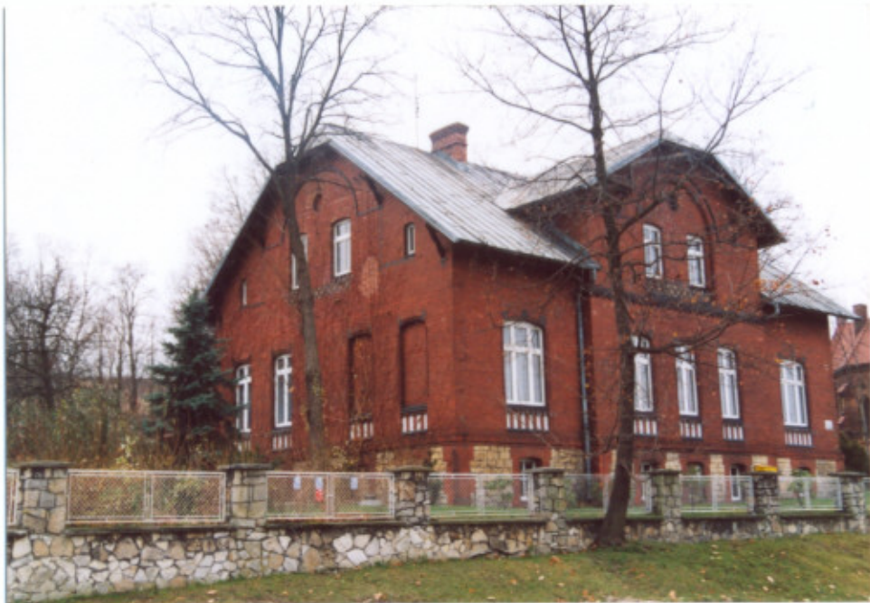
5. Widok od północnego-zachodu.