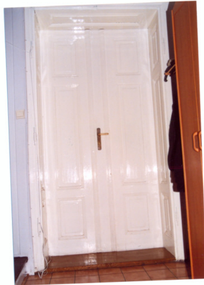
11. Stolarka drzwiowa.