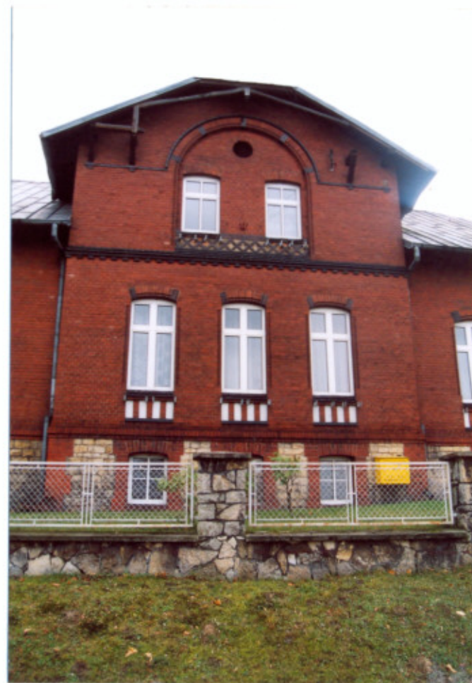
2. Frag. elewacji północnej. Ryzalit.