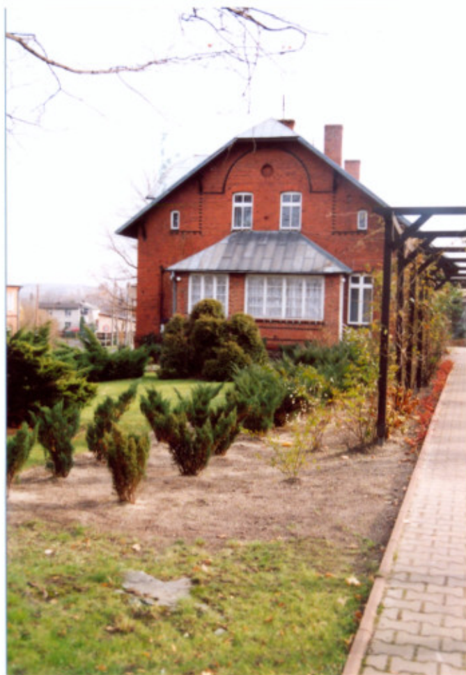
8. Elewacja zachodnia.