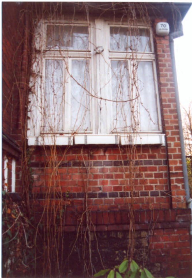
3. Frag. elewacji północnej-frontowej. Ganek.