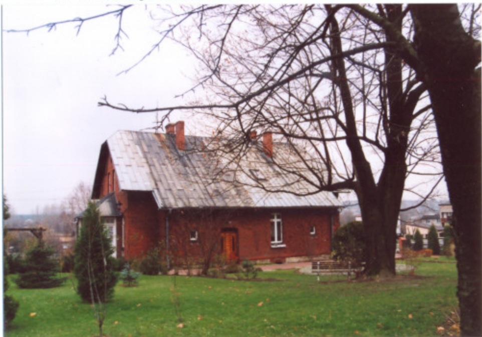
6. Elewacja południowa - tylna.