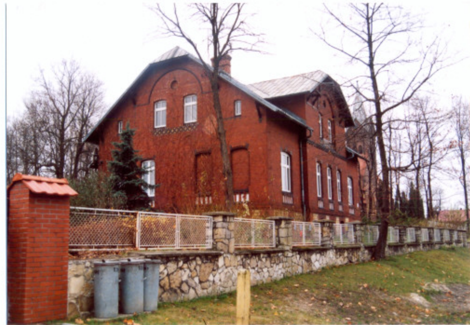
4. Widok od północnego-zachodu.