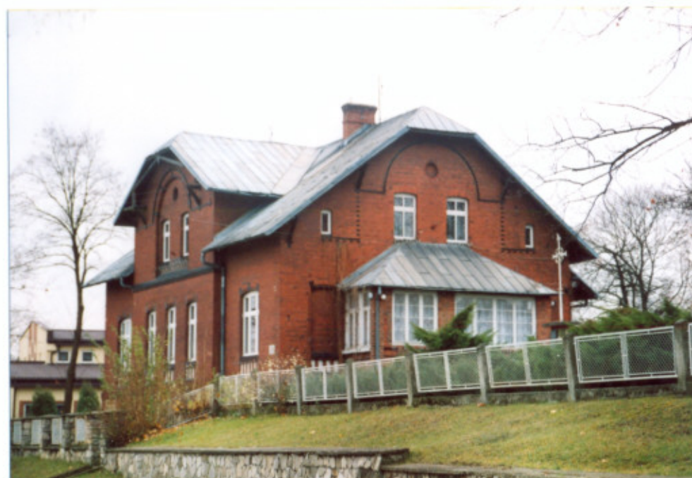
9. Widok od północnego-zachodu.