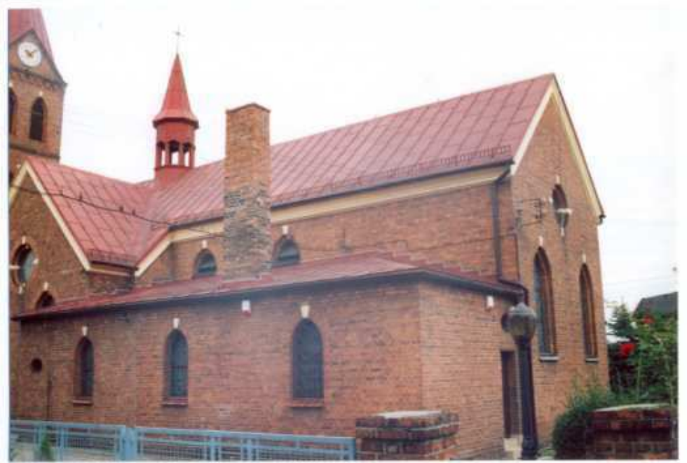
10. Frag. elewacji wschodniej.