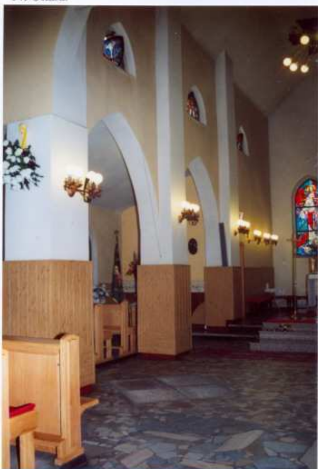
15. Nawa północna.