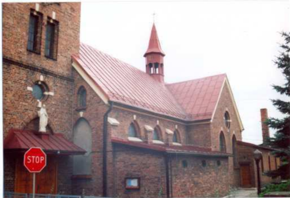
9. Frag. elewacji wschodniej.