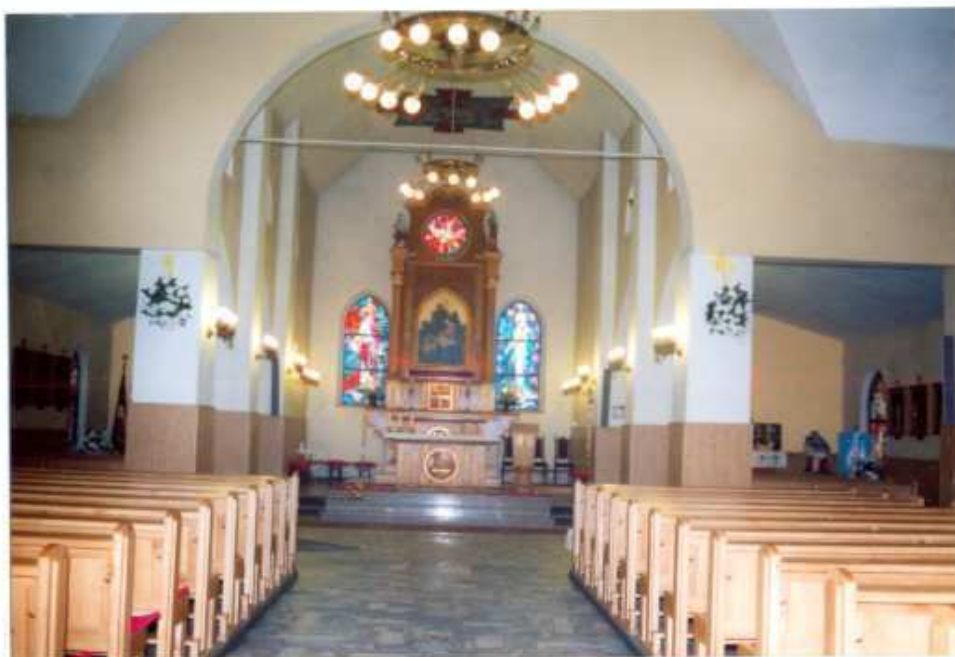
12. Widok ogólny na prezbiterium.