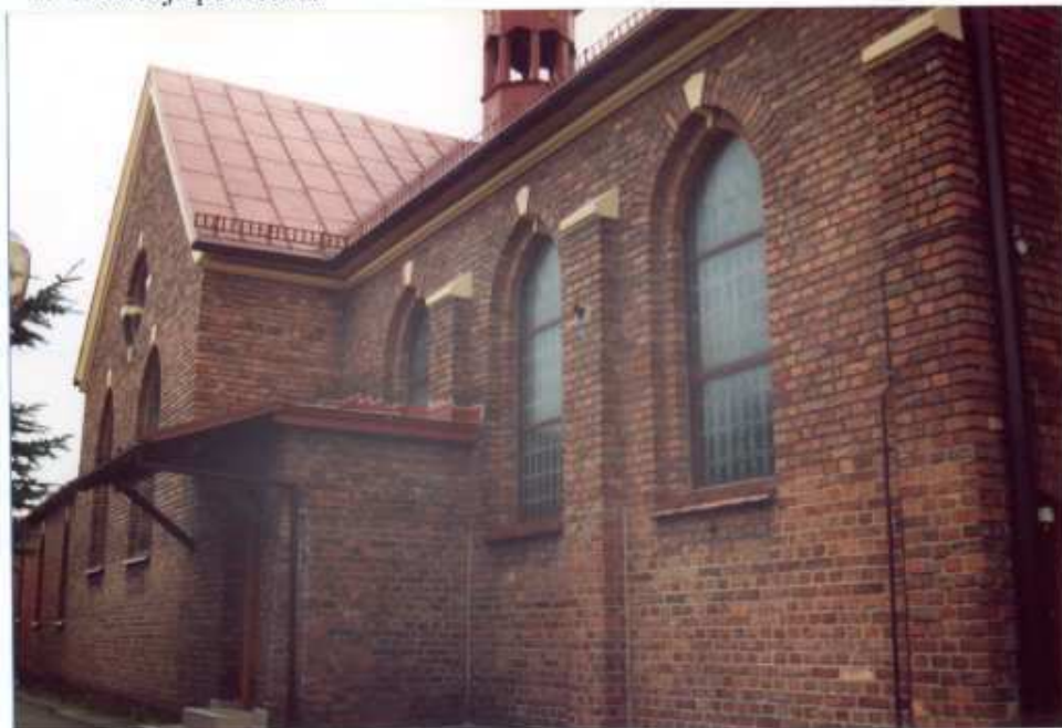
4. Frag. elewacji północnej.