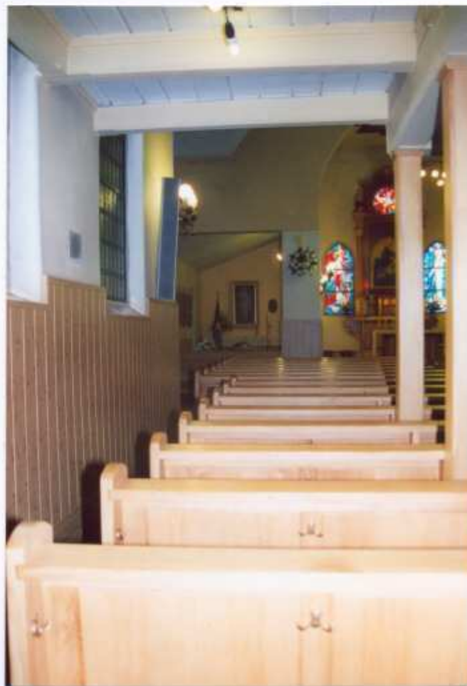
16. Nawa północna. Widok od nawy kościoła.