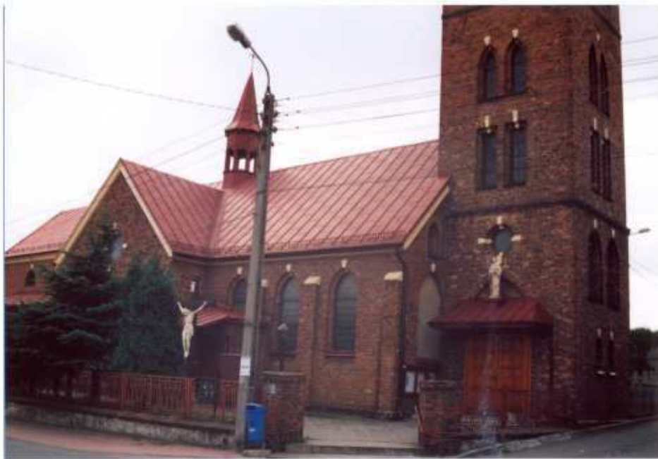
3. Elewacja północna.