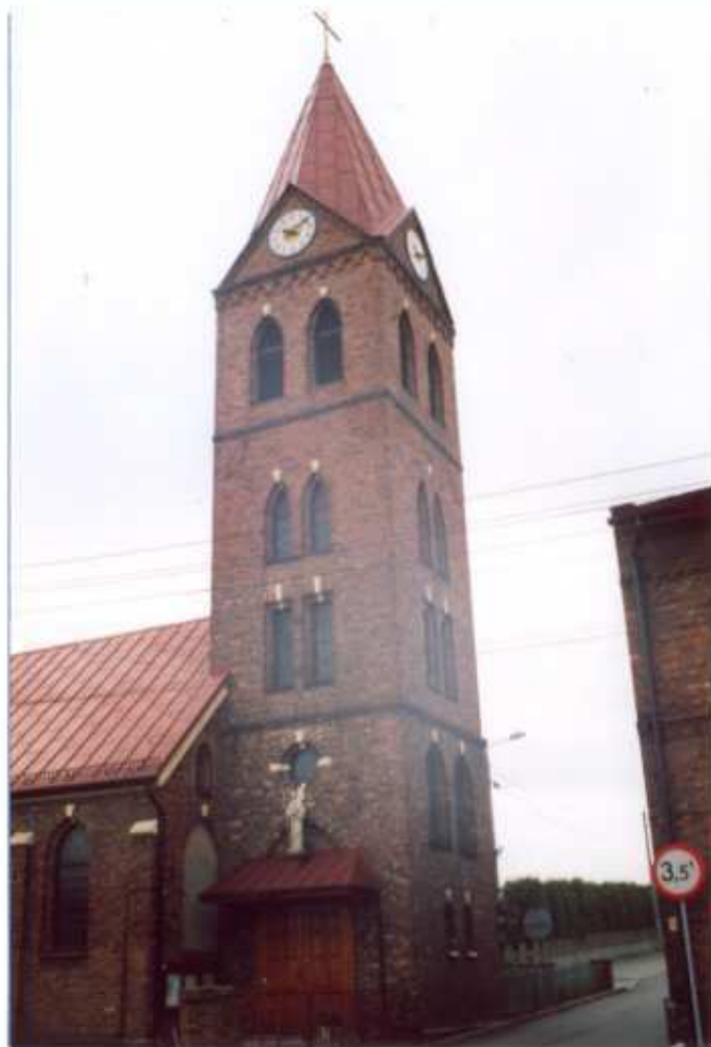
1. Elewacja zachodnia.