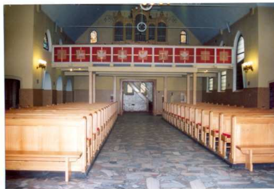
13. Widok ogólny na chór muzyczny.