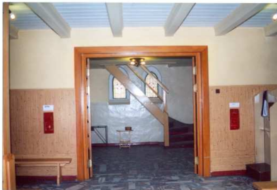
18. Widok ogólny na kruchnę zachodnią.