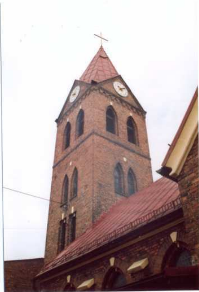
6. Widok ogólny od południowego wschodu.