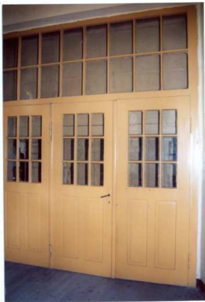
20. Stolarka drzwiowa.