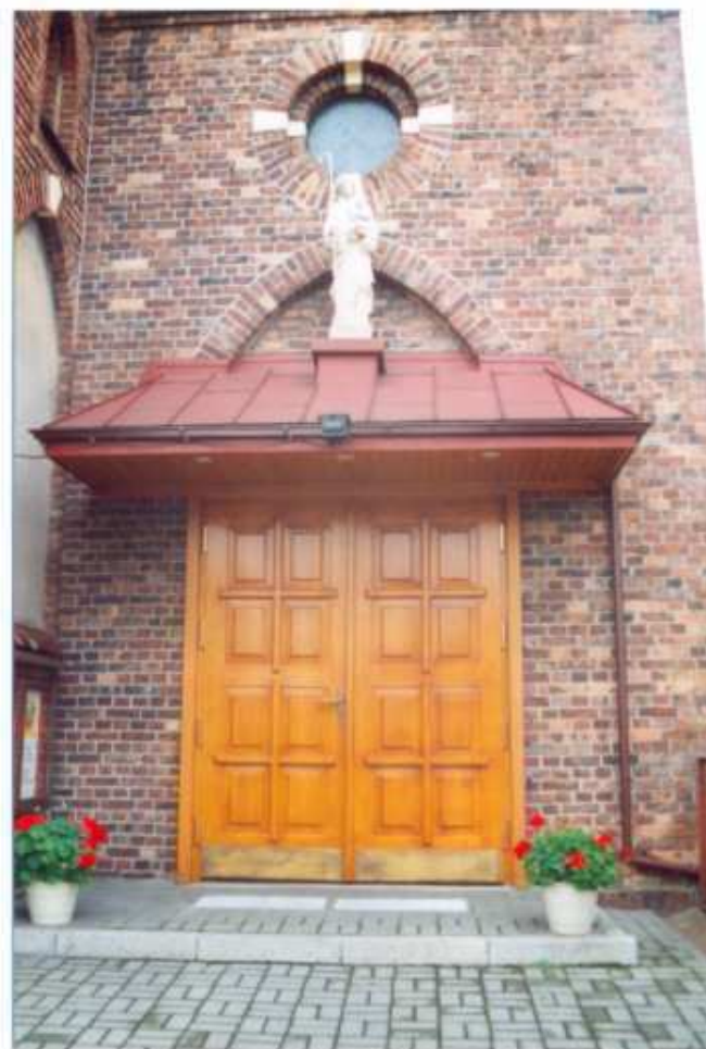
7. Frag. elewacji wschodniej.