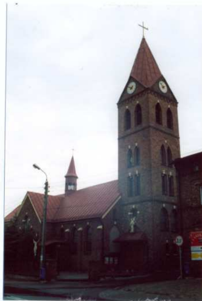
2. Widok ogólny od północnego-zachodu.

Kartę złożyła mgr Urszula Pawłowska, sierpień 2002 r.