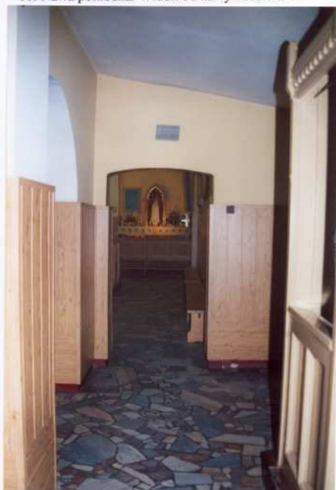
17. Nawa południowa. Widok od nawy kościoła.