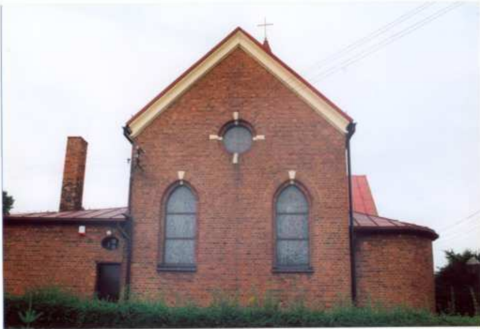
8. Elewacja wschodnia.